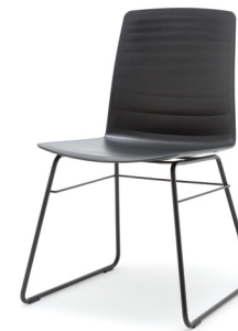
STU-KU Stuhl mit Kufe