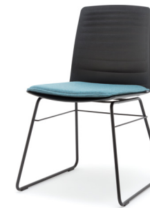
STU-KU mit SIK Stuhl mit Kufe und Sitzkissen