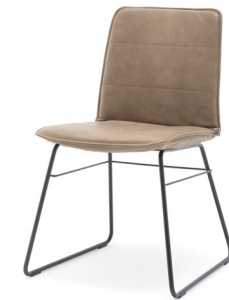
STU-KU mit Husse Stuhl mit Kufe und Husse