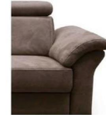
Var. 1 für Fuß-Var. 1-7