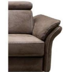
Var. 2 für Fuß-Var. 4-7